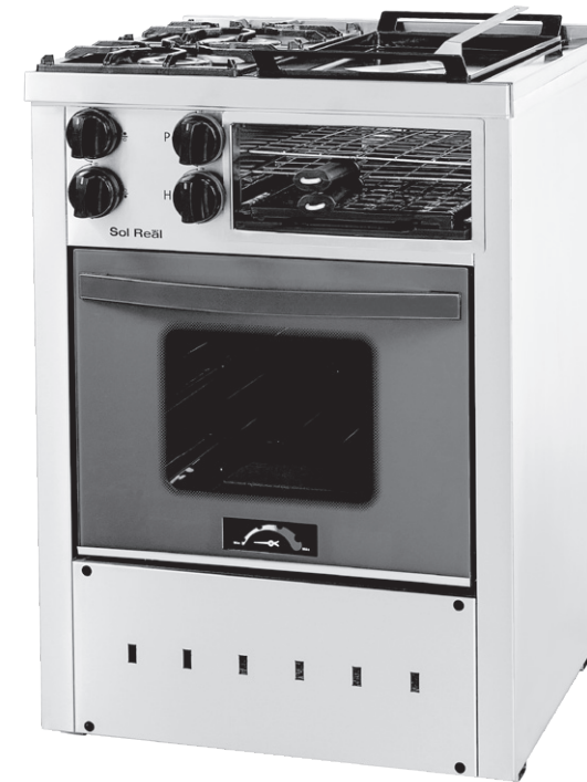
600 PVRP PUERTA DE VIDRIO ROJO 600 PVNP PUERTA DE VIDRIO NEGRO